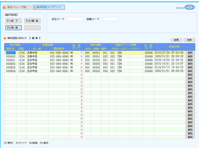
端末認証の登録・修正・削除を行う。